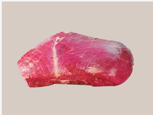
FOTOGRAFÍA DEL PRODUCTO