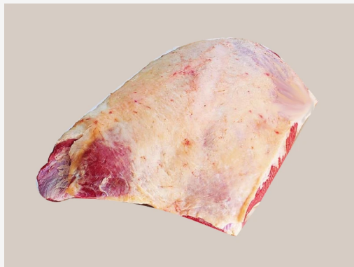
FOTOGRAFÍA DEL PRODUCTO